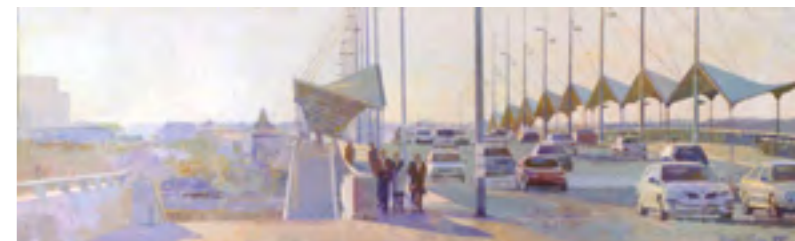
Puente del Cachorro, Enrique Morán

Sí, sí, sí, porque cada cabeza un mundo, entonces aprendes, te pones en el lugar del alumno y dices este muchacho ha pensado de esta manera, ha pensado de la otra. Puedes mirar, puedo tirar yo por ahí también o puedo aprender, claro.